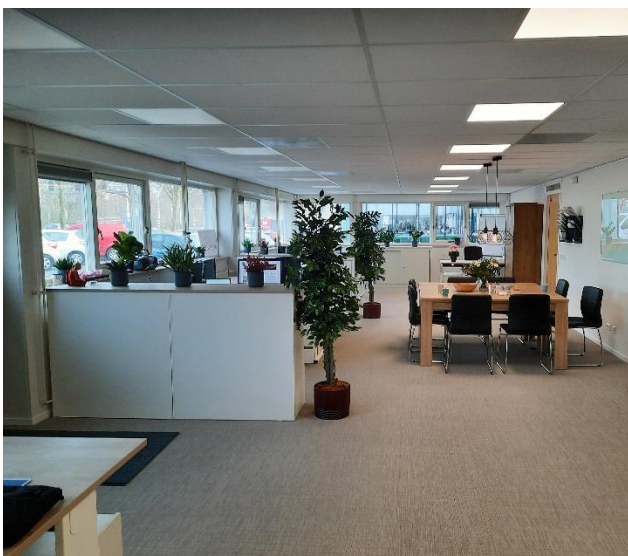
Het nieuwe kantoor van VH De Boog

Het gebouw van Intermaris is gesplitst in twee gedeelten. Een kant van het gebouw is verhuurd aan meerdere partijen waaronder VH De Boog, Vrijwillergerpunt, Parlan, Wilgaerden, Netwerk en Partner in Werk. Intermaris zit nog gewoon in dit gebouw zij hebben als u voor het gebouw staat het rechter gedeelte van het gebouw.