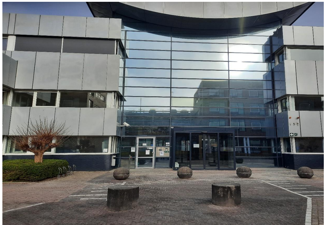
Het gebouw van Intermaris