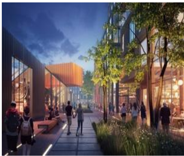
De gemeente betreft ook bewoners en ondernemers in het gebied bij de plannen.